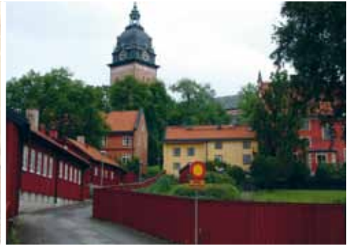
Foto: Virebild och altarskåp: Pernilla Eklund. Sommarbild: Strängnäs domkyrka