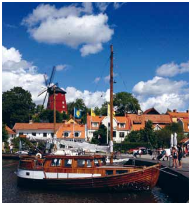
000 Penilla Eklund