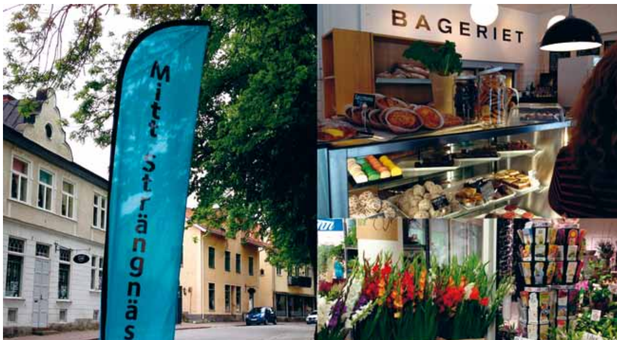
RD Pernilla Eklund