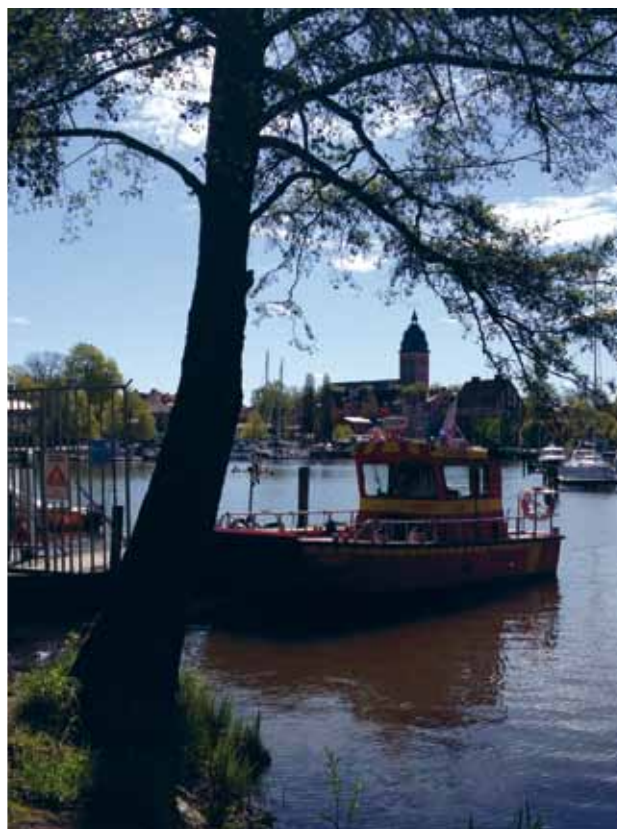
Yogaspass på Visholmen, foto av World Class. Strängnäs domkyrka, foto av Pernilla Eklund